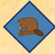
ビーバー スカウト向け